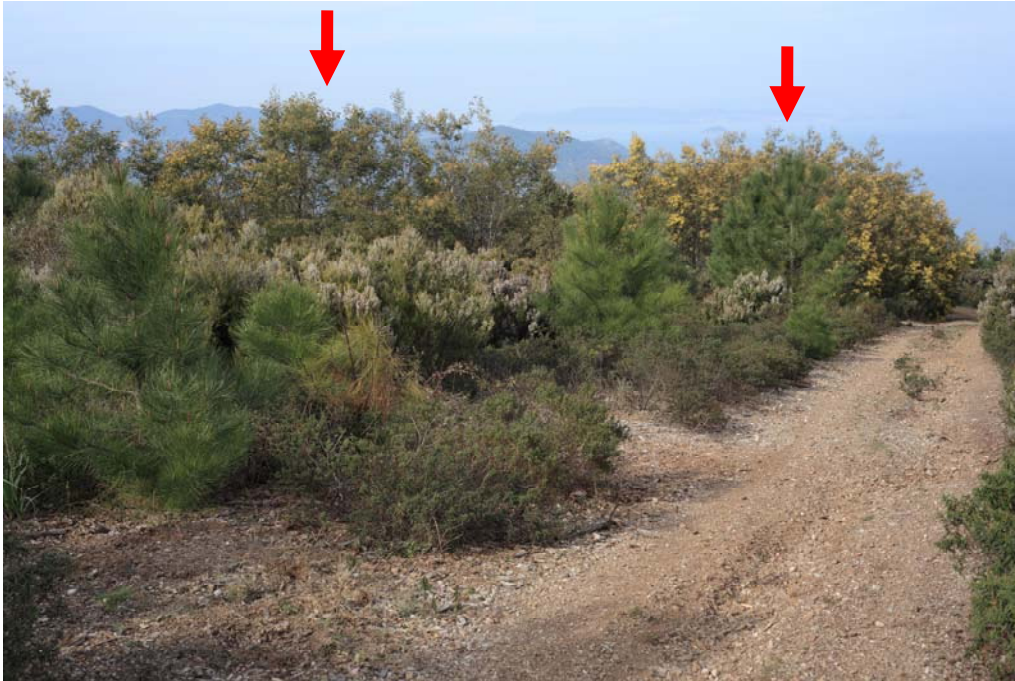
Fig. 7. Acacia dealbata L. (frece rosse)