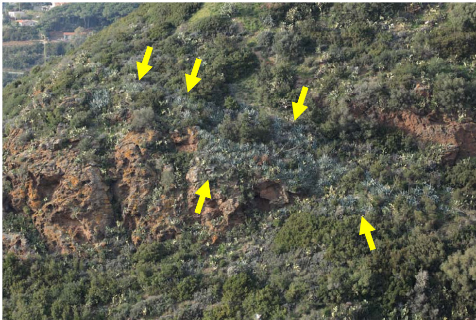
Fig. 2. Agave americana L. (frece gialle)