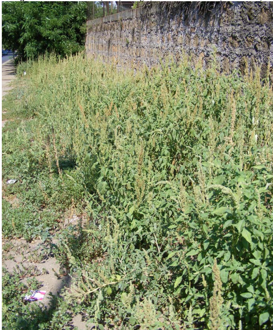
Fig. 4. Amaranthus retroflexus L.