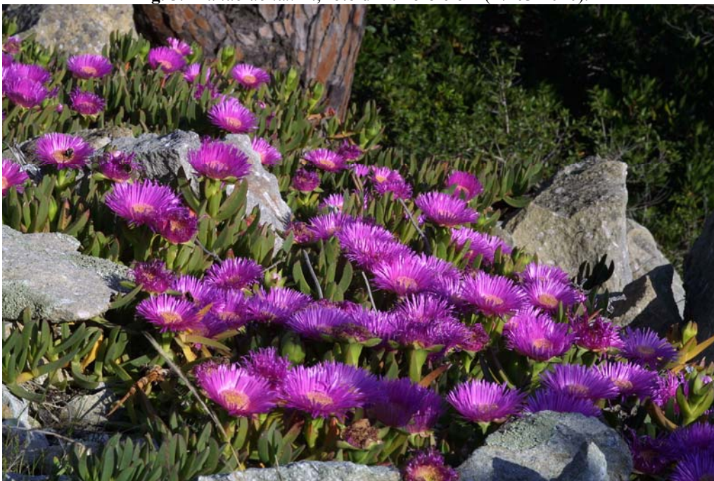
Fig. 6. Carpobrotus acinaciformis (L.) L. Bolus

Tra le naturalizzate, si rilevano 2 specie che mostrano una non trascurabile capacità di riproduzione e potenzialità invasive: