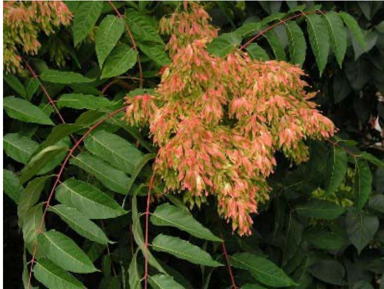
Fig. 3. Ailanthus altissima (Mill.) Swingle