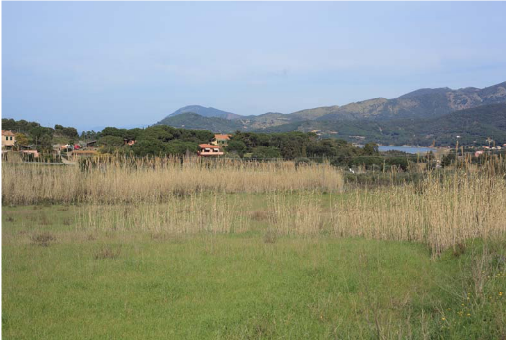
Fig. 5. Arundo donax L.