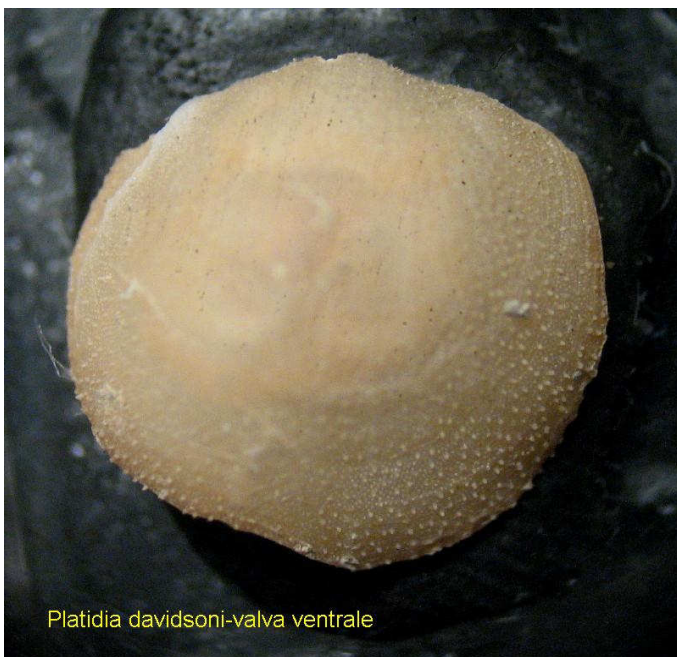
Platidia davidsoni-valva ventrale