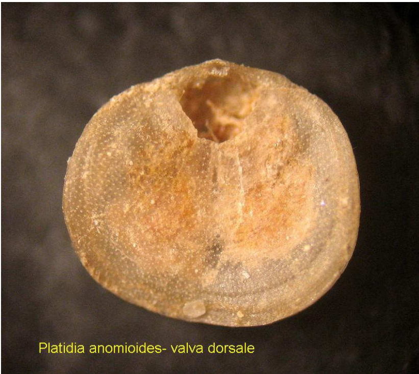
Platidia anomioides- valva dorsale