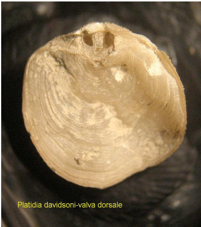
Platidia davidsoni-valva dorsale